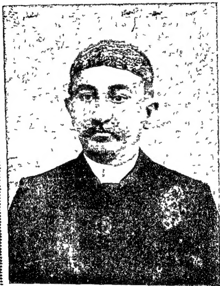
ਗੜ ਮੇਘਲਵਾਲ ਯੋਲਥੁ ਨੇ ਪੀ ੬੨-ਮਾਡਫੀਵਾਲਾ